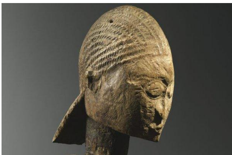
Un masque dogon

Le Centre multiplie depuis plusieurs années déjà des visites de musées et monuments historiques organisées avec différents partenaires. Avec un double objectif : offrir aux stagiaires, souvent reclus dans le monde du travail, des « échappées culturelles » et développer la convivialité. Dans ce domaine, les mois de mai et de juin sont particulièrement riches. C'est ainsi que le groupe alpha du quartier Kellermann et le groupe jeune (qui rassemble des jeunes primo arrivants de 16 à 25 ans suivant un stage intensif de 3h30 tous les matins) ont pu visiter, le 7 juin, au musée du quai Branly l'exposition consacrée à l'art et à la culture dogon qui présente notamment une remarquable série de masques et de sculptures.